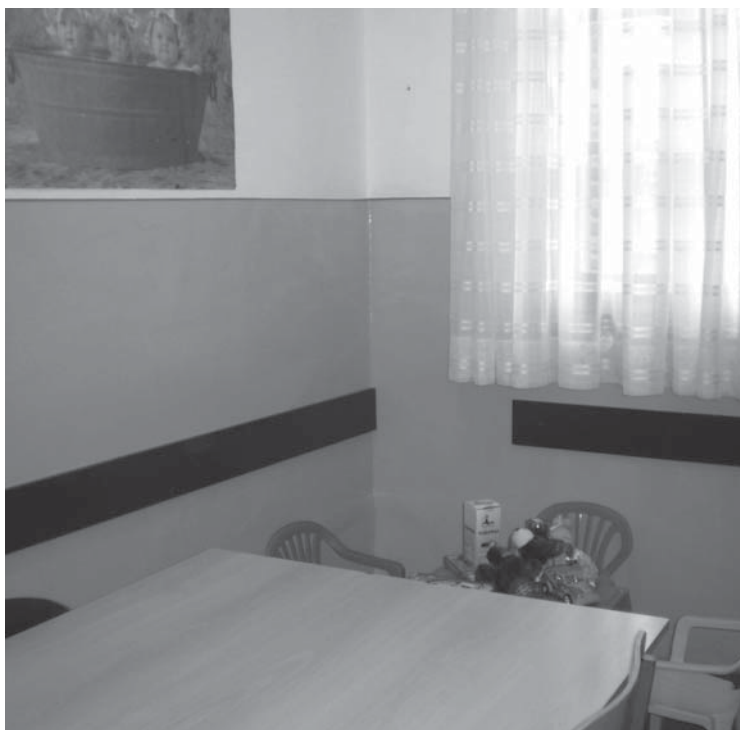
Zatvor u Šibeniku