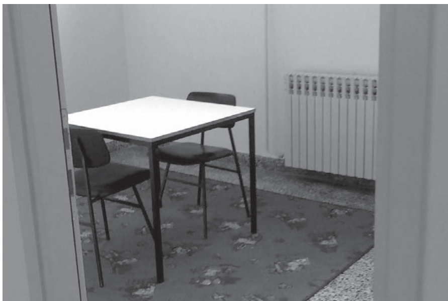
Kaznionica u Požegi - čekaonica nakon prilagodbe djeci