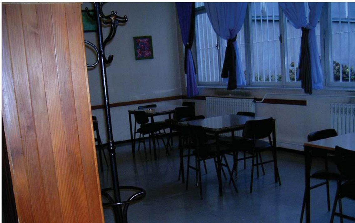
Kaznionica u Požegi - prostorija za posjete prije prilagodbe djeci