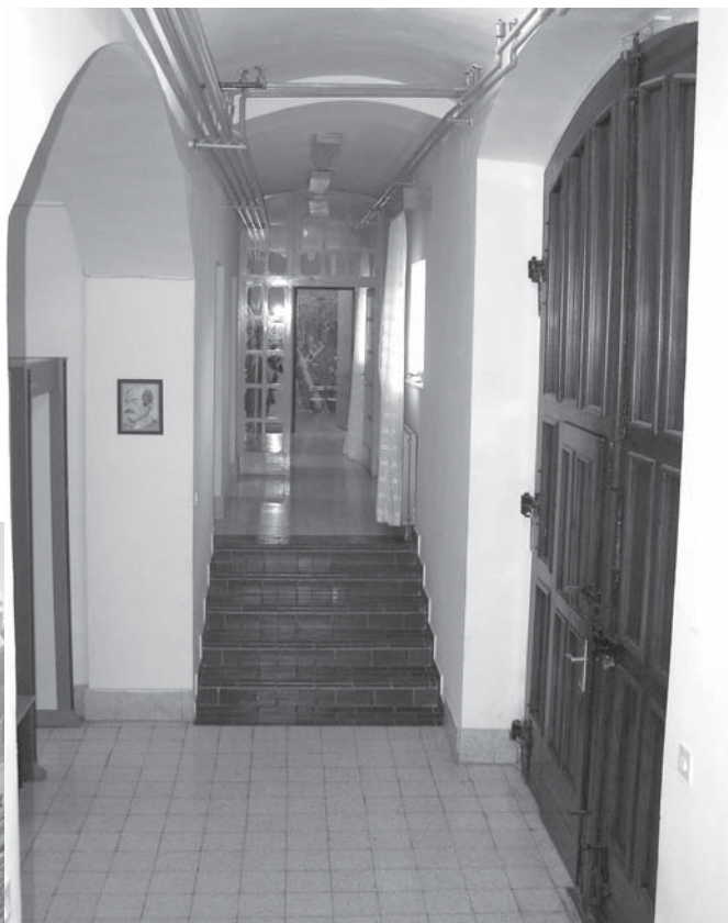
Zatvor u Gospiću