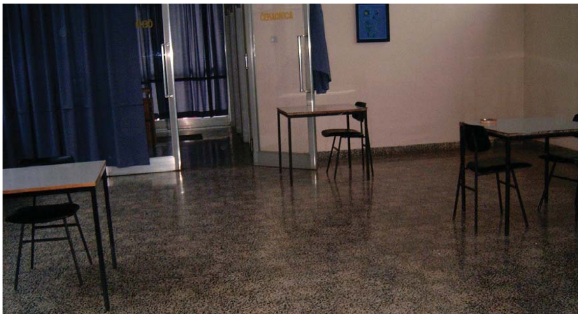
Kaznionica u Požegi - čekaonica prije prilagodbe djeci