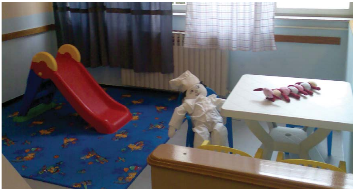
Kaznionica u Požegi - prostorija za posjete nakon prilagodbe djeci