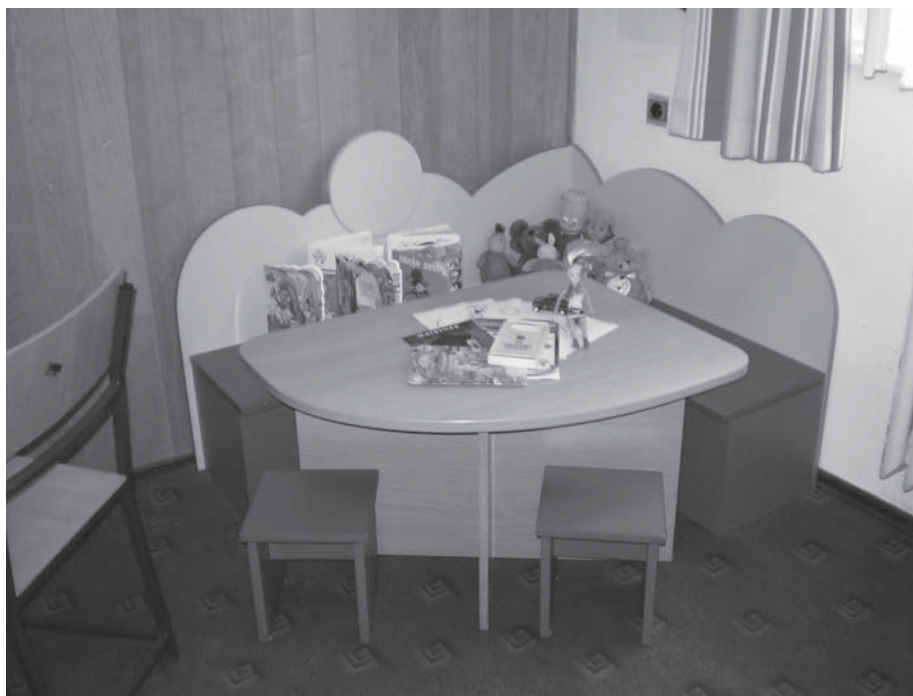
Kaznionica u Glini