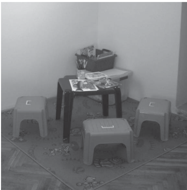
Zatvor u Zadru