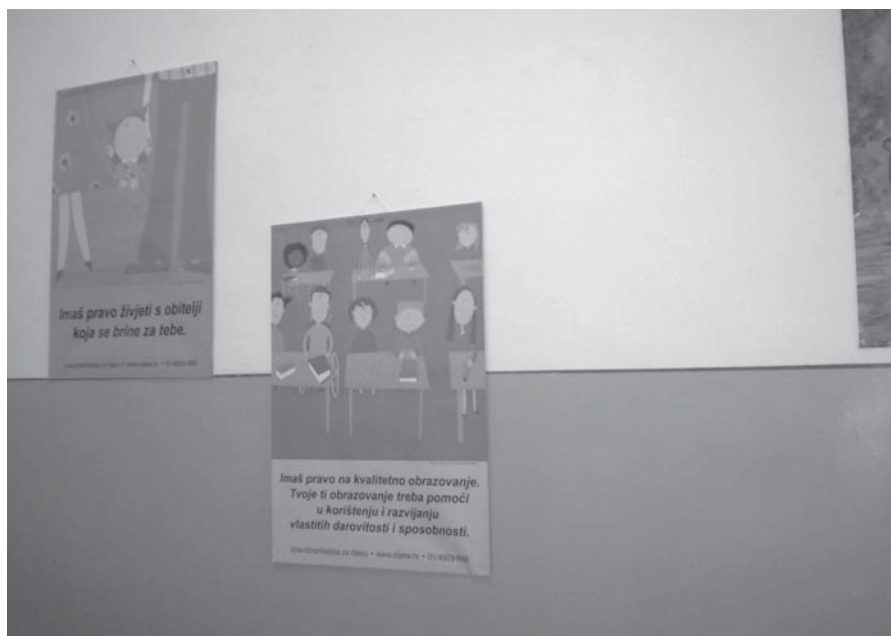
Zatvor u Šibeniku