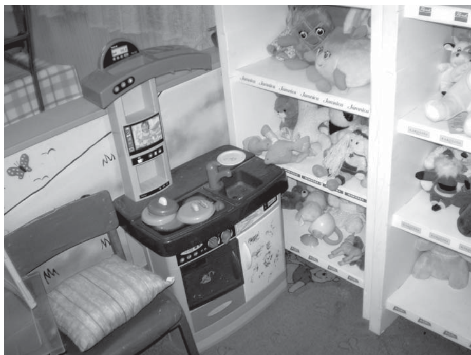
Zatvor u Osijeku