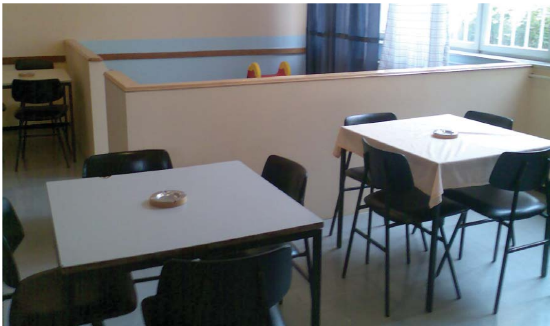
Kaznionica u Požegi - prostorija za posjetenakon prilagodbe djeci