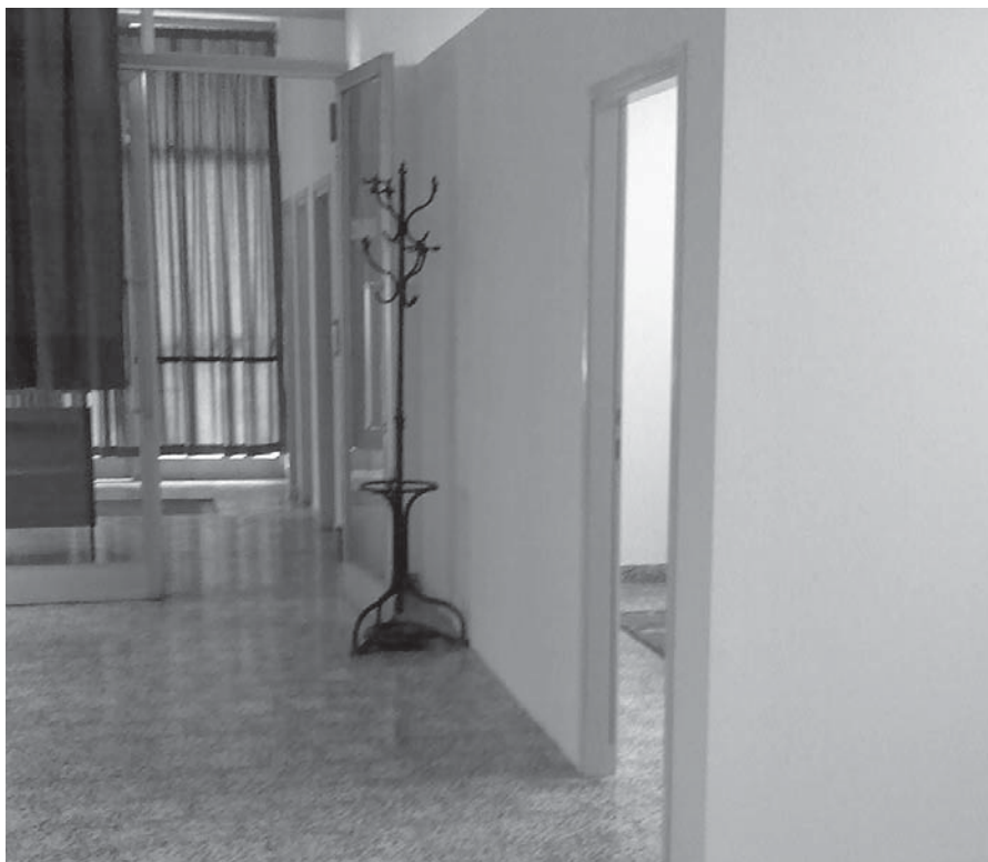
Kaznionica u Požegi - čekaonica nakon prilagodbe djeci