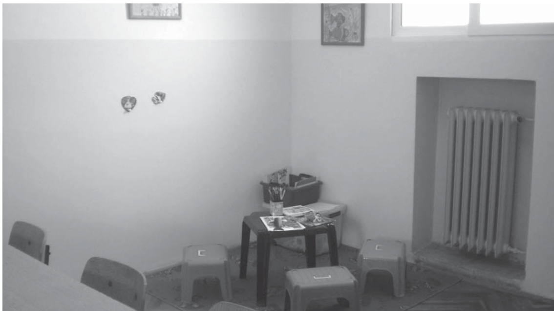
Zatvor u Zadru