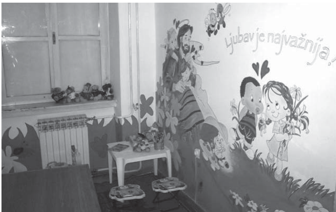
Zatvor u Rijeci