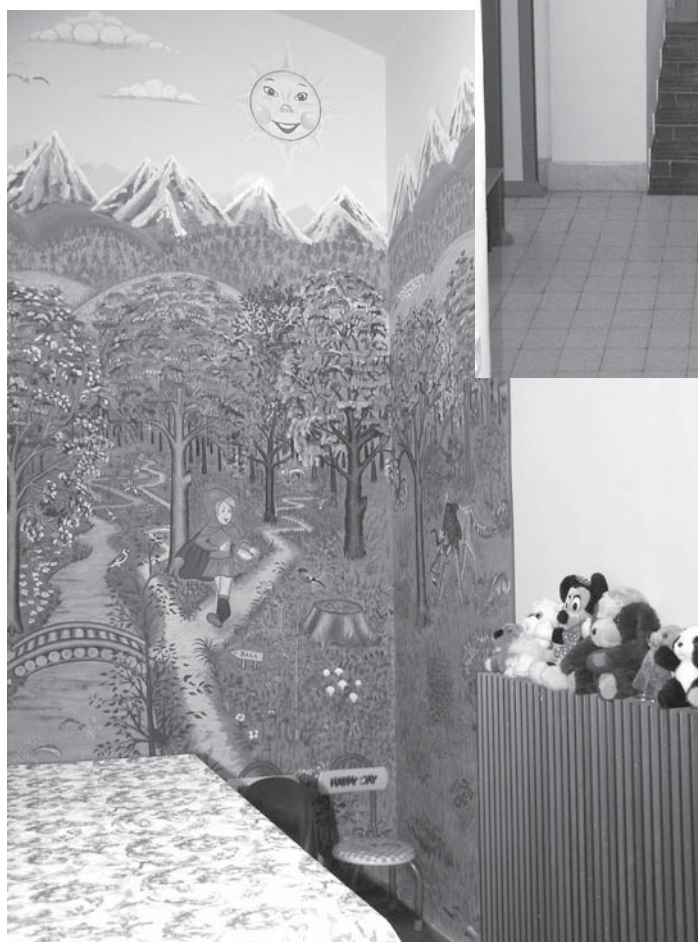
Zatvor u Gospiću