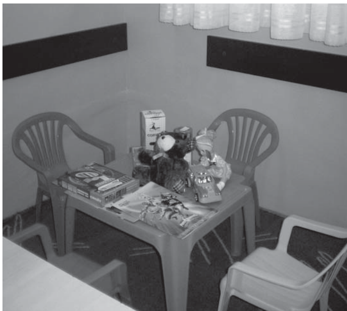
Zatvor u Šibeniku